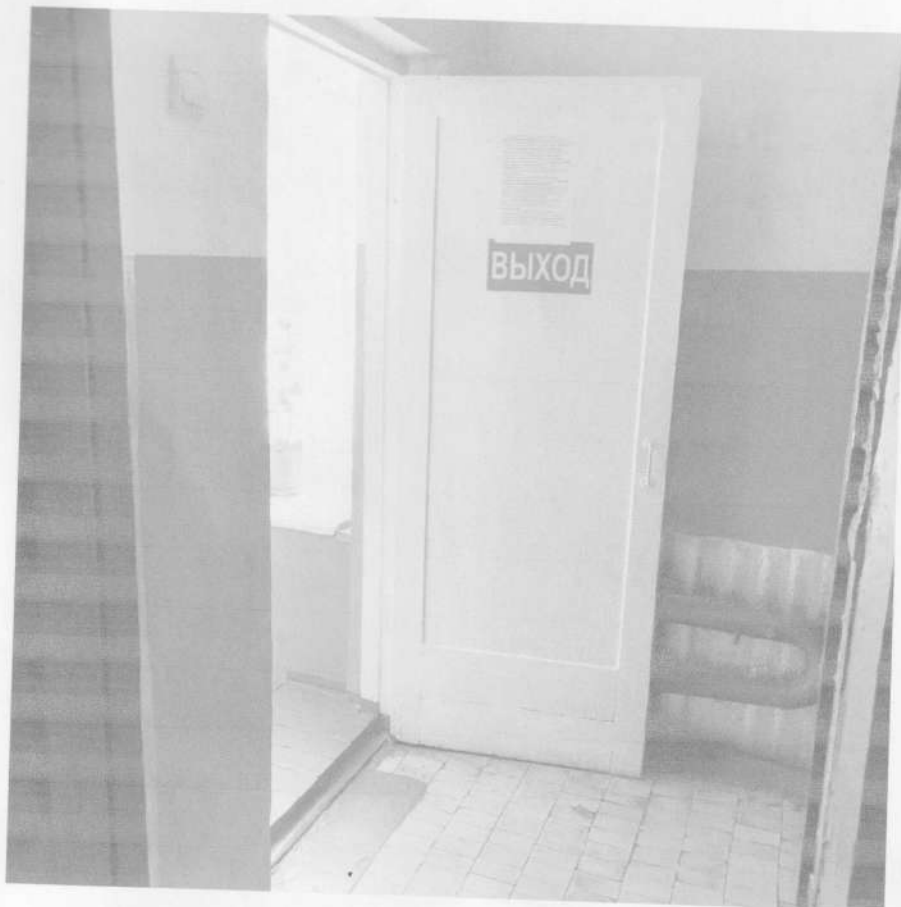
6. Коридор 1 этажа (19,35 x 1,40)